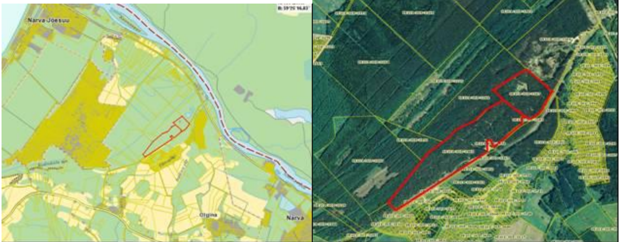
Joonis 1. Riigiküla kalmistu asukoht. (allikas: Maaameti kaardiserver, 2010).

Maa-ameti kaardiserveri andmetel on Riigiküla kalmistu maaüksuse sihtotstarbeks üldkasutatav maa, Tulevase maaüksuse sihtotstarbeks on hetkel 80% üldmaa ja 20% maatulundusmaa. Kavandatud tegevusega hõlmatud ala kogupindala on 48,3 ha, sellest 35,46 on olemasolev kalmistumaa. Lisaks piirneb kavandatava tegevusega hõlmatud ala Eesti Evangeelse Luterliku Kiriku Narva Aleksandri Koguduse Sininõmme kalmistu kinnistuga ning Peeterristi – Kudruküla T13147-II kõrvalmaanteega. Ülejäänud osas ümbritsevad katastriüksuseid maatulundusmaad.