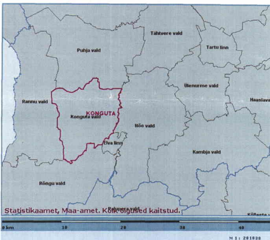
Joonis 1. Konguta valla asukoht Tartu maakonnas külgnevate omavalitsustega (Allikas: Maa-amet, 2008)

Konguta valla üldplaneeringu keskkonnamõju strateegiline hindamine algatati lähtudes "Keskkonnamõju hindamise ja keskkonnajuhtimissüsteemi seaduse" § 33 lõike 1 punktist 2 Konguta Vallavalitsuse 14. mai 2007.a otsusega nr 55.