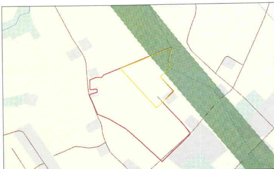
Joonis 5. Väljavõte maakonnaplaneeringu teemaplaneeringust; Papiaru lauda maaüksus (punane joon), detailplaneeringu ala (kollane joon; 10 ha puhul), rohekoridor (roheline ala).

ei jää väärtuslikke maastikke, ilusaid teelõike ja vaatekohti ega ka kõrge puhkeväärtusega alasid.