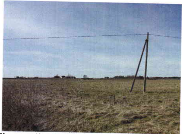
Joonis 3. AS Rakvere Lihakombinaadi sõnnikuhoidla (vasakul); vaade detailplaneeringuga hõlmatavale alale (paremal); fotod: 24.04.2008.

Detailplaneeringu ala asub täies ulatuses Pandivere ja Adavere-Põltsamaa nitraaditundlikul alal. Põhjavesi on nõrgalt kaitstud kuni kaitsmata, kaitsmata põhjaveega ala on toodud joonisel 4.