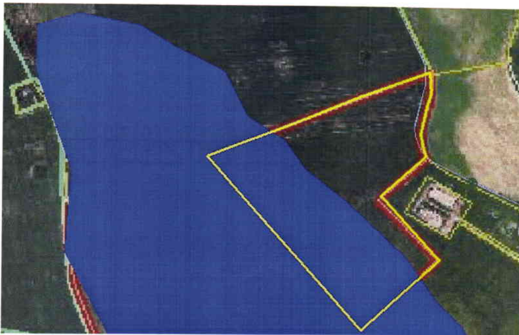
Joonis 4. Detailplaneeringu ala (10 ha puhul), kaitsmata põhjaveega ala (sinine), Pandivere ja Adavere-Põltsamaa nitraaditundlik ala järgi.

Detailplaneeringu ala asub täies ulatuses Pandivere ja Adavere-Põltsamaa nitraaditundlikul alal. Põhjavesi on nõrgalt kaitstud kuni kaitsmata, kaitsmata põhjaveega ala on toodud joonisel 4.