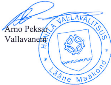
Arno Peksar Vallavanem

4. Korraldus jõustub teatavakstegemisest