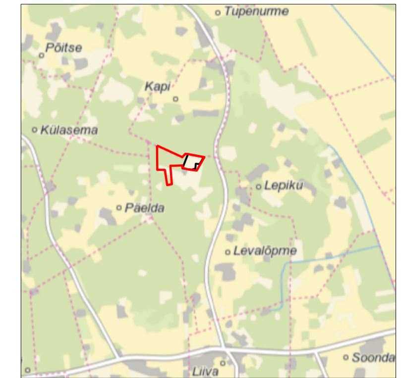
Kaardilehed nr 5243 Virtsu, 6221 Puise