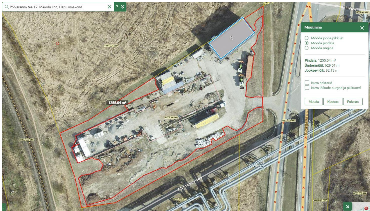
Joonis 2. Haljasala suurus on ca 1255m 2 e. rohkem kui 20% kinnistu pindalast.

*Nõue on ebamõistlik- toome näiteks Kaldase tee 6 asuvat Muuga jäätmejaama (Joonis 3), kus võetakse lisaks kõiksugu muudele jäätmeliikidele vastu aia ja pargijäätmeid.