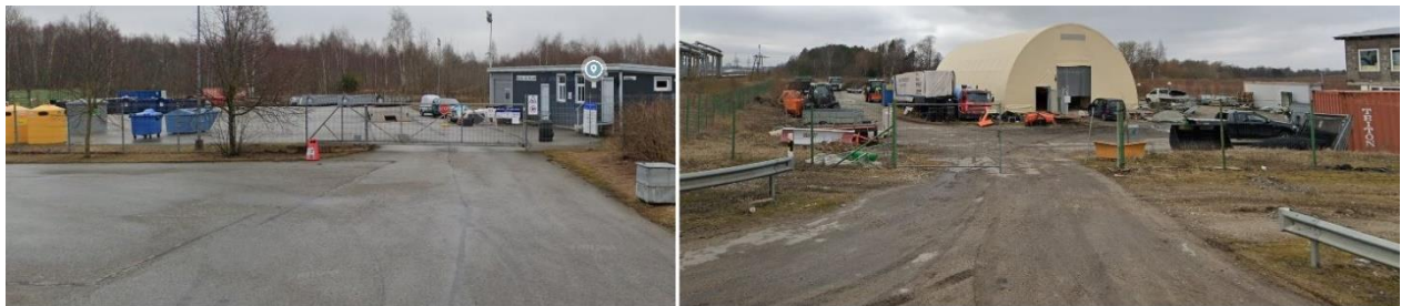
Joonis 3. Muuga jäätmejaama (vasakul) piirete võrdlus käitise piirdeaiaga (paremal).

*Nõue on ebamõistlik- toome näiteks Kaldase tee 6 asuvat Muuga jäätmejaama (Joonis 3), kus võetakse lisaks kõiksugu muudele jäätmeliikidele vastu aia ja pargijäätmeid.