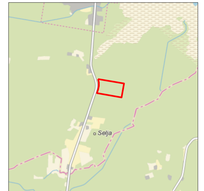
Kaardileht nr 6312 Järvakandi