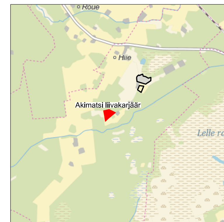
Kaardileht nr 6323 Kaiu, 6321 Vädra