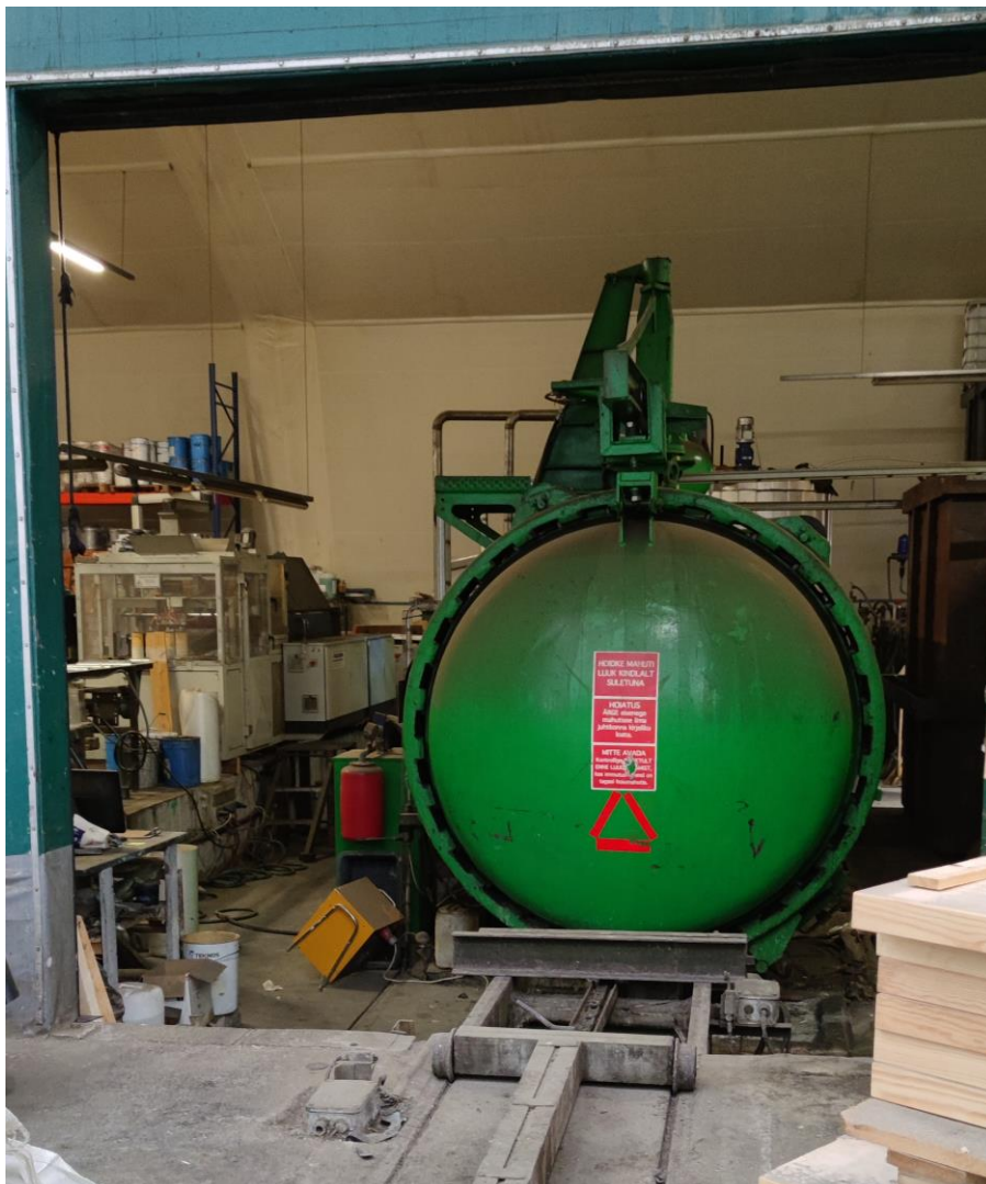
Joonis 3. Immutusprotsessi ala. Põrand ülejäänud tasapinnast madalam ja betoneeritud.

Autoklaavi suunamise eelselt hoiustatakse kemikaalilahuseid vahemahutites. Mahutid paiknevad hoones sees betoneeritud, põranda tasapinnast madalamal alal, mille maht on piisav võimaliku lekke korral kogu ohtliku kemikaali mahutamiseks.