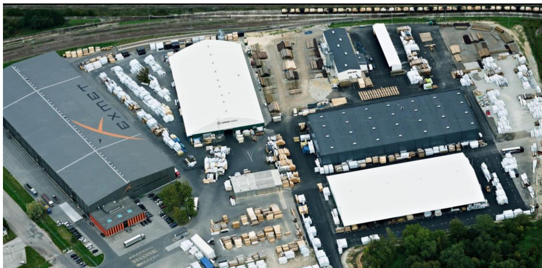
Joonis 1. Vaade käitisele.